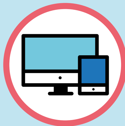
100% EN LÍNEA

A continuación encontrarás información detallada de cada uno.